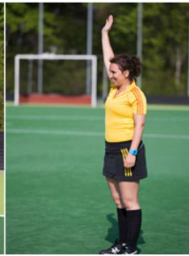
Spelhervatting na doelpunt